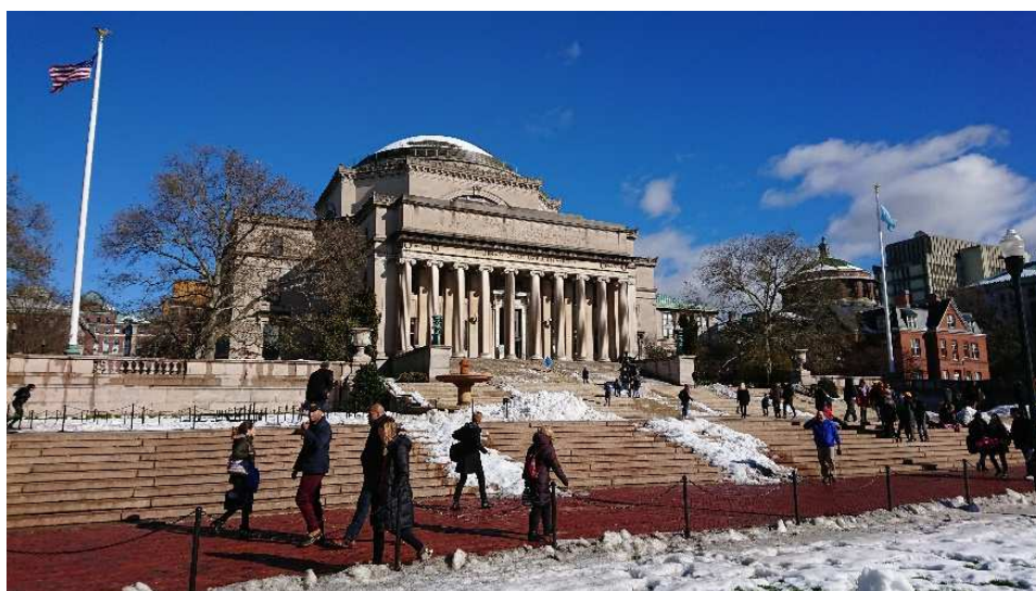
Obr. 1: Low Memorial Library v areálu Kolumbijské univerzity se zbytky sněhu z rekordní listopadové sněhové bouře z 15. listopadu.

Konference 'Geography 2050' je víceletý projekt organizovaný Americkou geografickou společností (AGS), jehož cílem je budovat strategický dialog mezi představiteli akademické (geografické) obce, vládních institucí a podnikatelskou sférou. Konference je pořádána každoročně od roku 2014 a snaží se podpořit diskusi o hlavních silách, které budou formovat budoucnost naší planety. Tématy předchozích ročníků konference byly budoucnost, urbanizace, udržitelnost a mobilita. Tématem letošního ročníku (2018) byla energie, která je jedním z nejdůležitějších faktorů ovlivňujících současnou geopolitiku, světovou ekonomiku, vojenské konflikty, kvalitu životního prostředí, systémy dopravy, technické inovace, produkci potravin, životní úroveň a mobilitu obyvatel a další aspekty života současné společnosti.